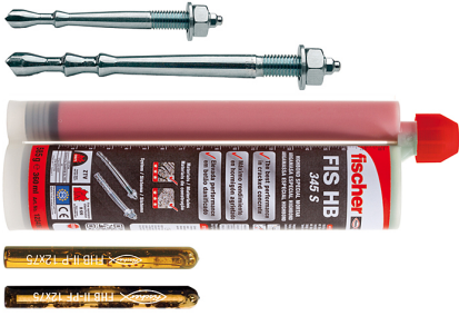
Highbond-System FHB II