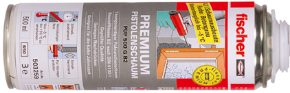
1K Pistolenschaum PUP G B2